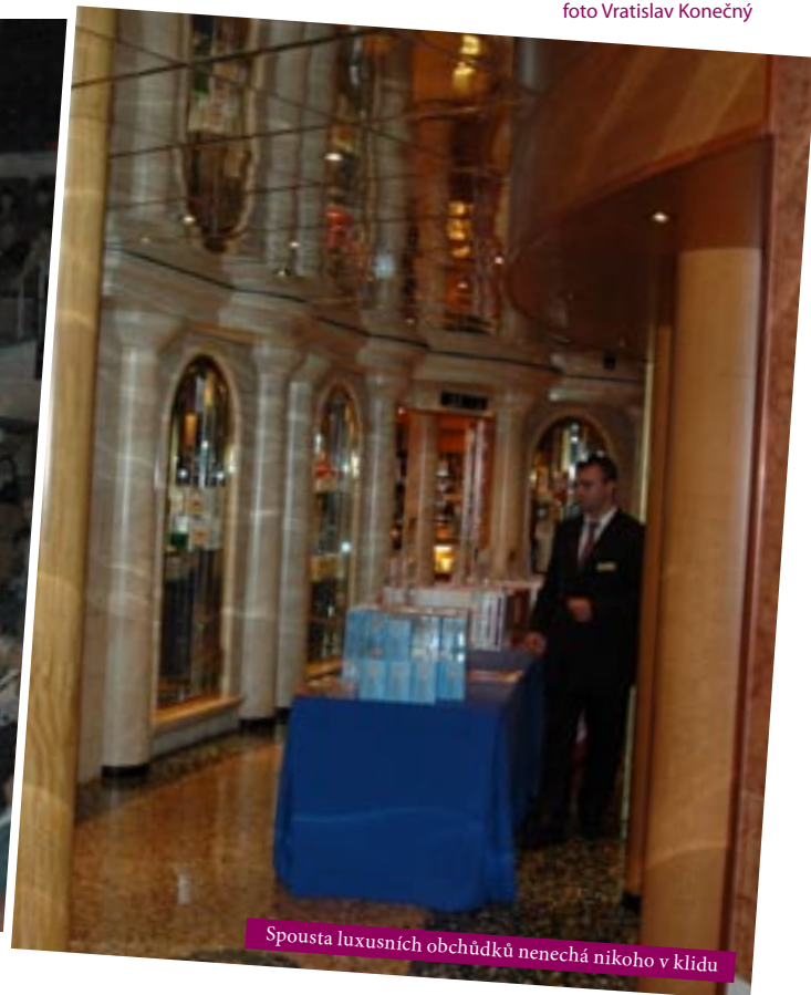
Spousta luxusních občůdků nenechá nikoho v klidu