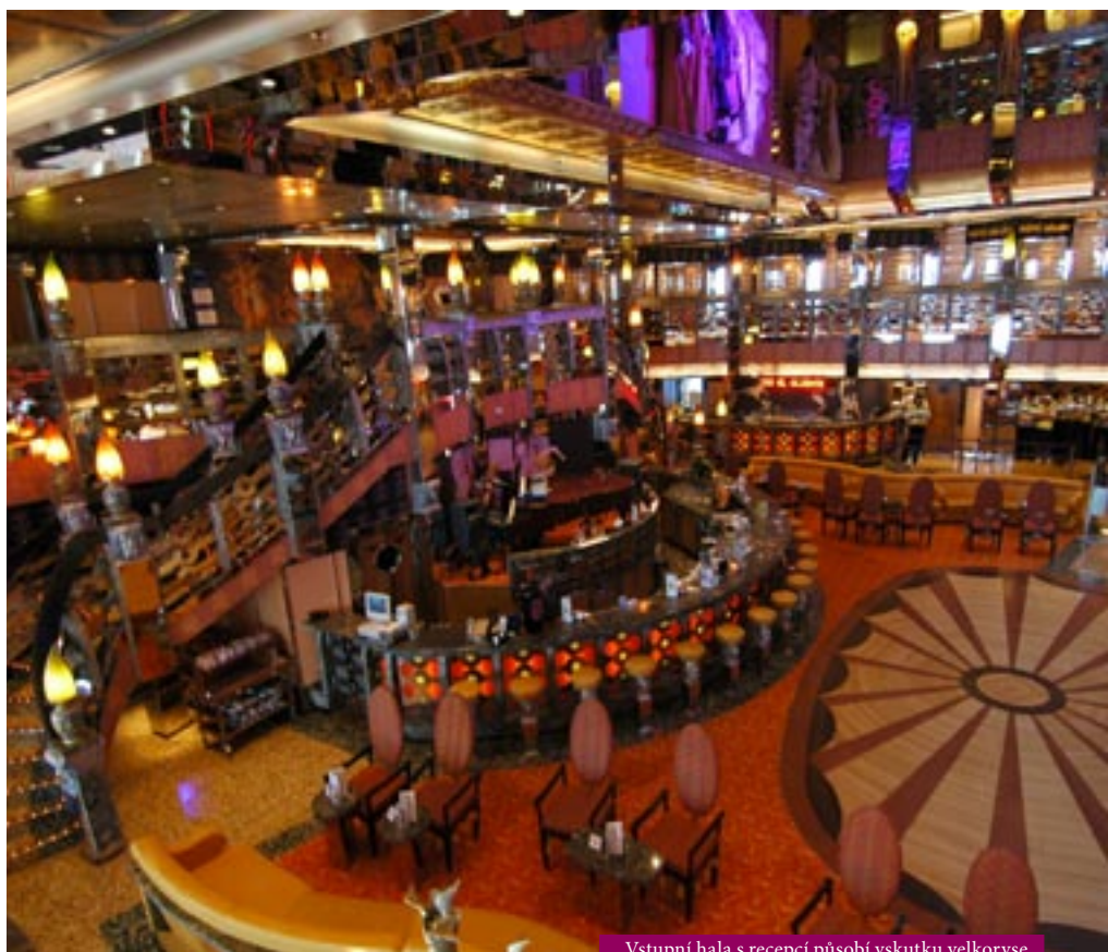
Vstupní hala s recepcí působí vskutku velkoryse

Tak a teď čekáte finanční smršť, která zlikviduje vaše konto. Není to tak hrozné,