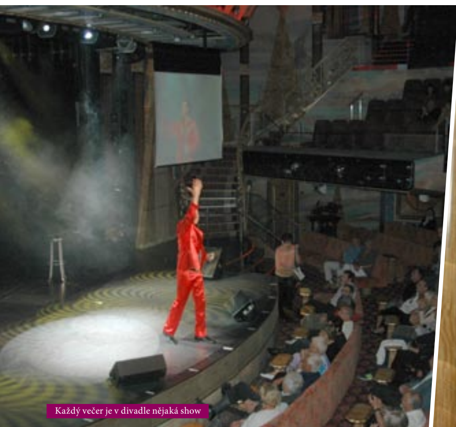
Každý večer je v divadle nějaká show

z paluby Medierraney Vratislav Konečný