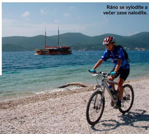
Ráno se vyloďíte a večer zase nalodíte.