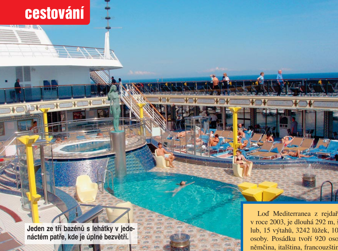
Jeden ze tří bazénů s lehátky v jedné patře, kde je úplně bezvětrí.