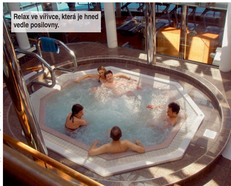
Relax ve vířivce, která je hned vedle posilovny.