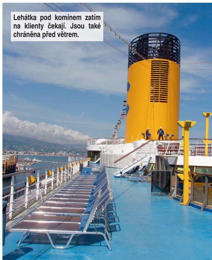
Lehátko pod komínem zatím na klienty čekají. Jsou také chráněna před větrem.

www.orbislink.cz , www.okruzniplavby.cz , www.costa.cz