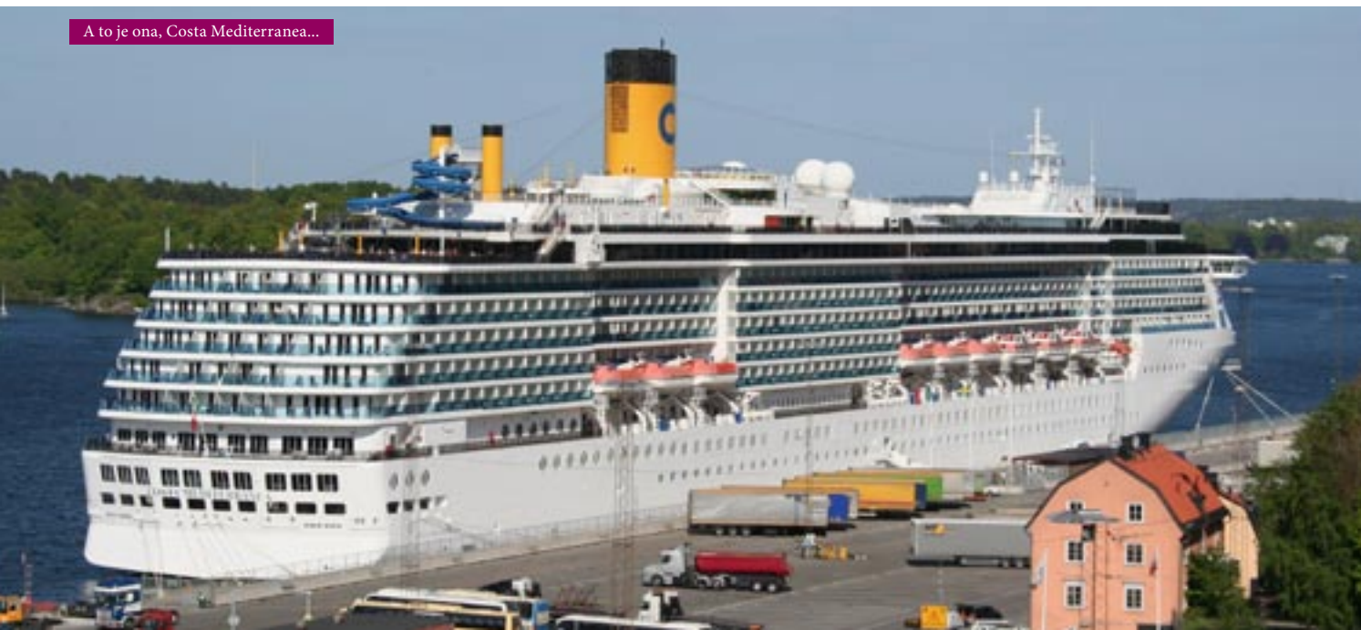
A to je ona, Costa Mediterranea...